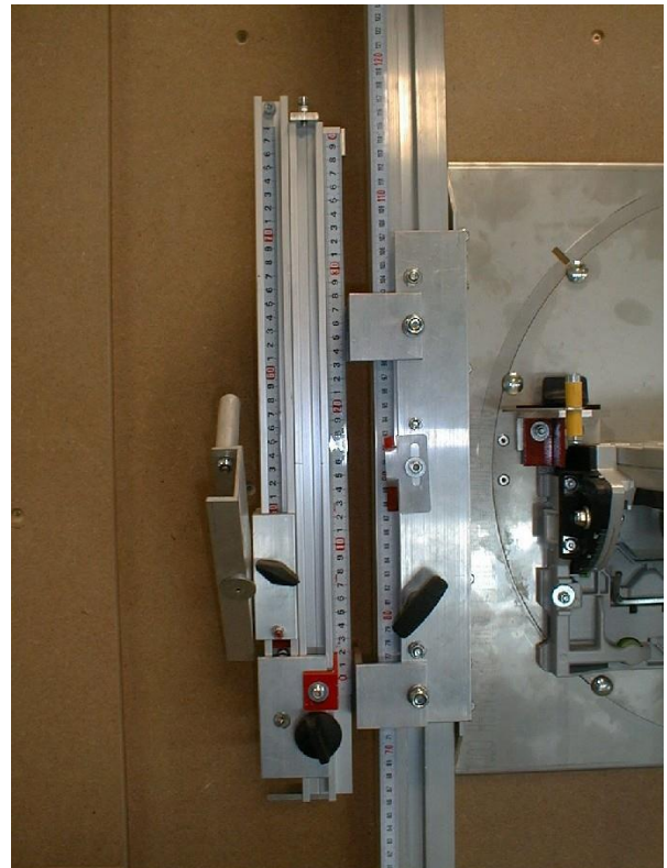
Drehscheibe und Schiebeschlitten mit Wiederholungsanschlag (Links)

Im Schiebeschlitten befindet sich die Drehscheibe aus VA-Stahlblech, welche an 2 Zugseilen aufgehängt ist. Auf dieser Drehscheibe wird die Tauchsäge TS 75 EBQ montiert. Die Drehscheibe kann um 90° gedreht werden für horizontale bzw. vertikale Schnitte. Ein Rastbolzen fixiert die Positionen. Zusätzlich befindet sich unter der Drehscheibe ein Andruckschuh. Dieser Andruckschuh drückt das Plattenmaterial auf die MDF-Auflageplatte.